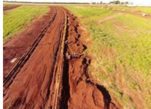
Imagem 5: Exemplo de rede de distribuição subterrânea.

ser mais segura, pois está menos sujeita a danos causados por tempestades ou outros eventos climáticos.