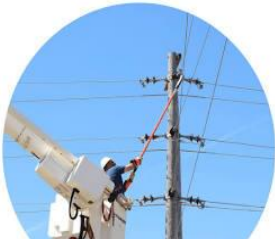
Imagem 1: Exemplo de rede de distribuição aérea.