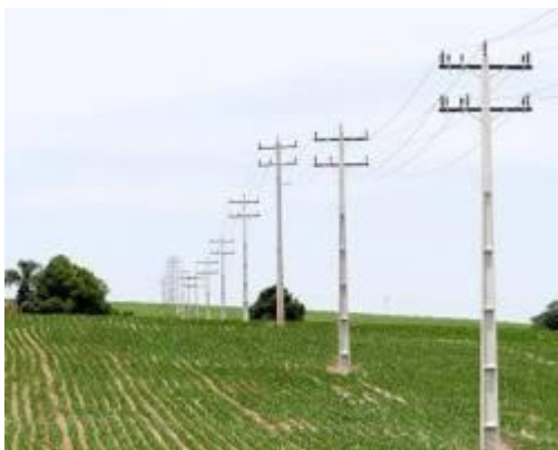
Imagem 4: Exemplo de rede de distribuição aérea.

Rede aérea: Este é o tipo mais comum de rede elétrica rural. Os cabos elétricos são suspensos em postes de madeira ou concreto.