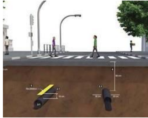
Imagem 2: Exemplo de rede distribuição subterrânea.