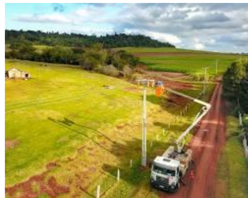
Imagem 6: Exemplo de rede de distribuição inteligente.

Rede de distribuição inteligente: Este tipo de rede elétrica usa tecnologia avançada para monitorar e controlar o fluxo de energia. Isso pode ajudar a melhorar a confiabilidade da rede e reduzir as perdas de energia.