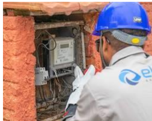
Imagem 3: Exemplo de rede de distribuição inteligente.